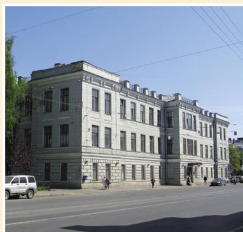
Рис. 2. Клиника травматологии и ортопедии им. Г.И. Турнера.

фессора кафедры. Почти полвека он безупречно проработал на родной кафедре.