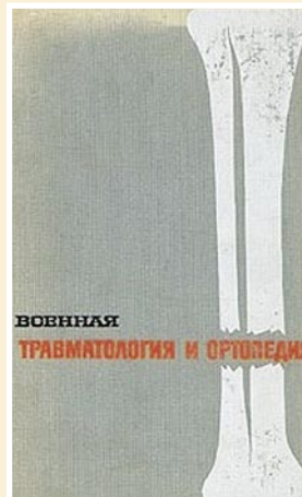
Рис. 6. Учебник «Военная травматология и ортопедия».