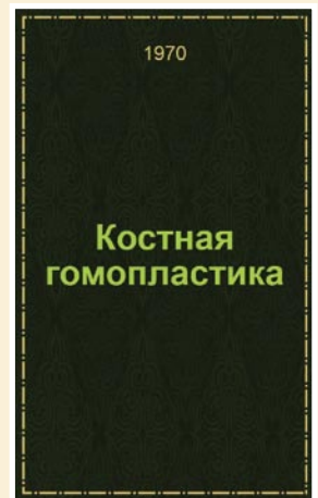
Рис. 5. Монография «Костная гомопластика».