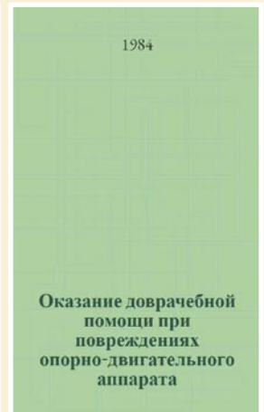
Рис. 8. Учебное пособие.

провождались интенсивной рационализаторской и изобретательской работой. Самим С.С. Ткаченко было получено 47 авторских свидетельств на изобретение и внедрено более 170 рационализаторских предложений. В 1989 г. он был удостоен почётного звания «Заслуженный изобретатель РСФСР» (Рис. 9).