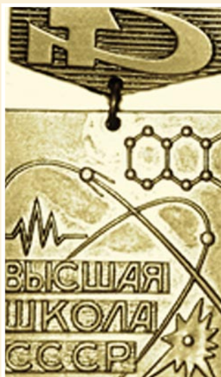
Рис. 10. Почетный знак «За заслуги в области высшего образования СССР».