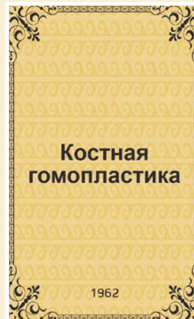
Рис. 4. Автореферат докторской диссертации С.С. Ткаченко.