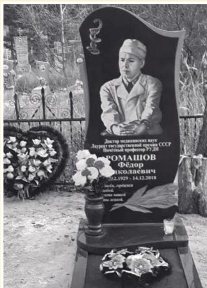
Рис. 2. Могила Ф.Н. Ромашова.

следующем этот труд был переведен на разные языки и издан уже в Германии, Болгарии, Финляндии и Японии.