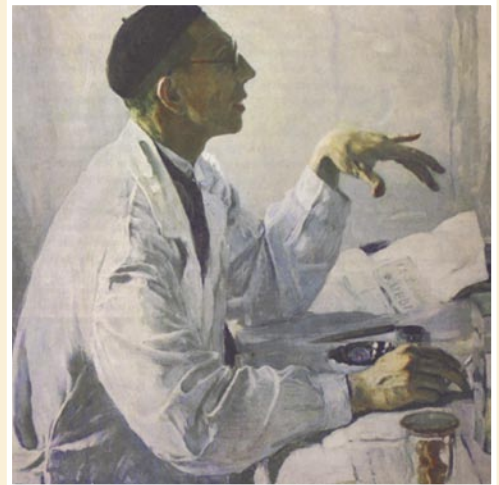
Рис. 3. М.В. Нестеров. Портрет хирурга С.С. Юдина. 1935, Государственная Третьяковская галерея.