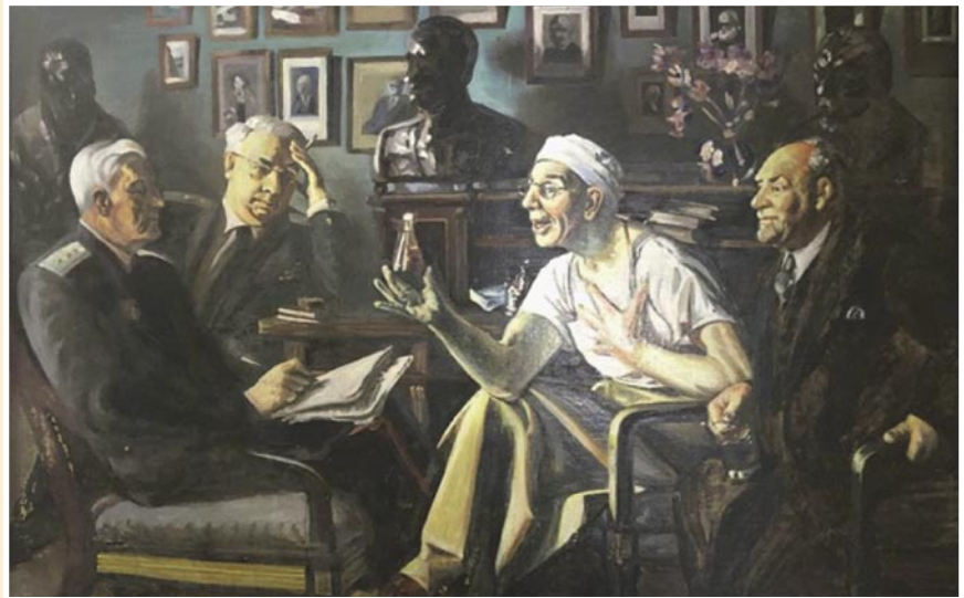
Рис. 11. А.И. Лактионов. Картина «После операции» (1965 г.). Курская картинная галерея им. А.А. Дейнеки.