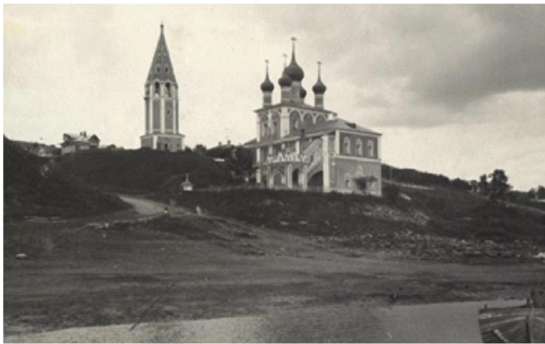
Рис. 2. Набережная Волги в городе Романов-Борисоглебск (фотография начала XX века).