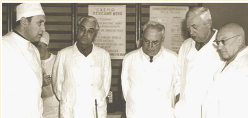
Рис. 9. Слева направо: начальник отделения анестезиологии и реанимации В.Г. Борисов, начальник кафедры ВПХ ВМФ РМАПО полковник медицинской службы И.И. Дерябин, генерал-лейтенант медицинской службы Бочаров А.А., начальник госпиталя — генерал-майор медицинской службы С.И. Поздняков, академик АМН СССР генерал-полковник медицинской службы А.А. Вишневский.

в т.ч. тромбоземболических осложнений и нагноения ран. Активнее стала оказываться хирургическая онкологическая помощь. Главный хирург полностью обеспечивал оказание хирургической помощи в госпитале как в консультативном плане, так и в выполнении всего объёма оперативных вмешательств (Рис. 6, 7).