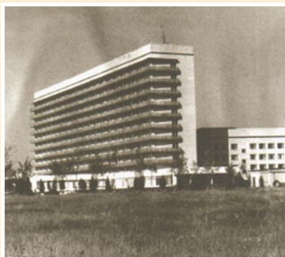
Рис. 8. Комплекс зданий госпиталя в Красногорске при его открытии.