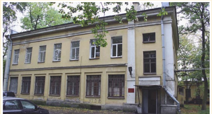
Рис. 5. Здание, в котором в прошлом веке размещалась кафедра и клиника военно-морской госпитальной хирургии академии.

рук, за которыми приятно было наблюдать не только в ходе самой операции. Экономные движения отличались неповторимым артистизмом, до блеска отработанной точностью манипуляций при выполнении спинномозговой анестезии». Сам С.С. Юдин писал: «Хирургическая техника есть неотъемлемая, важнейшая и незаменимая часть лечения в хирургической клинике» [3]. Сергей Сергеевич в числе первых был избран действительным членом созданной в 1944 г. Академии медицинских наук СССР [4].