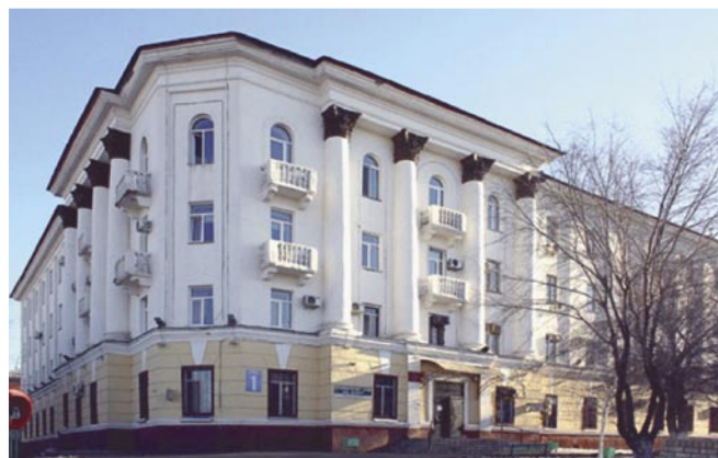
Рис. 3. ГАУЗ «ГКБ №4» г. Оренбурга, клиническая база кафедры травматологии, ортопедии и военной хирургии.