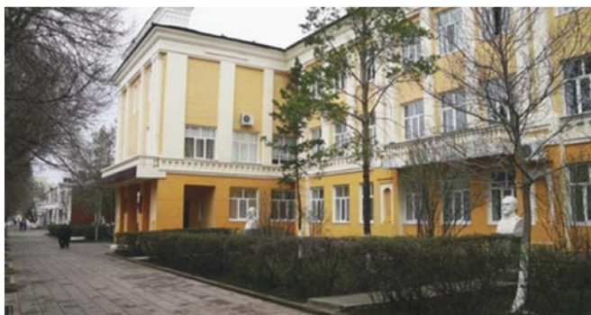
Рис. 4. Учебный корпус №1, в котором расположен ректорат медицинской академии.