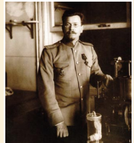
Рис. 3. Николай Павлович Кравков, профессор, руководитель кафедры фармакологии Военно-медицинской академии.

течений, набор инструментов для операции на желчных путях), разработаны операции, такие как субкапсулярная нефрэктомия и пиелотомия « in situ ». Значительную роль в развитии полостной хирургии сыграло применение хирургом Федоровым С.П. внутривенного гедоналового наркоза (совместно с фармакологом Н.П. Кравковым) (Рис. 3).