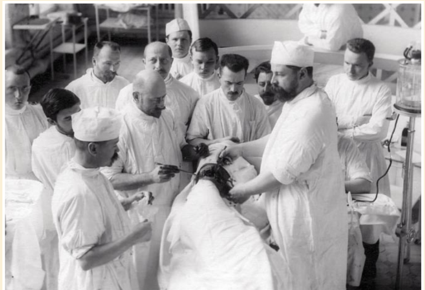
Рис. 4. Опирирует профессор С.П. Федоров.

Трудные годы пришлось пережить в период Великой октябрьской революции. Сергей Петрович отказался от предложения переехать по приглашению брата за границу. Приняв решение остаться в России кризисного периода, профессор показал свое стремление развивать отечественную хирургию и стремление служить народу. Но в связи с заграничной перепиской был дважды арестован в первые годы революции, находился в предварительном заключении во время следствия. В освобождении Федорова С.П. сыграло роль ходатайство правления Русского хирургического общества Н.И. Пи-