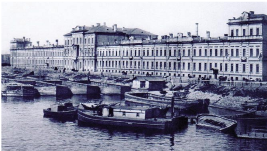
Рис. 2. Вид со стороны Петропавловской крепости на здание клинического военного госпиталя с Невы.