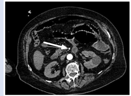
Рис. 1. Мультиспиральная КТ органов живота с внутривенным контрастированием. Стрелкой указан просвет второго сегмента верхней брыжеечной артерии.

В послеоперационном периоде пациентке дважды проводилась ревизия и программная санация брюшной полости. Однако ввиду сохраняющегося тяжело перитонита наложить межкишечный анастомоз не представилось возможным. Кроме того, во время повторной санации и ревизии брюшной полости от 18.05.2024 года было установлено прогрессирование ОНМЗК с некрозом и перфорацией стенки подвздошной кишки на расстоянии 10 см от её культи. Была