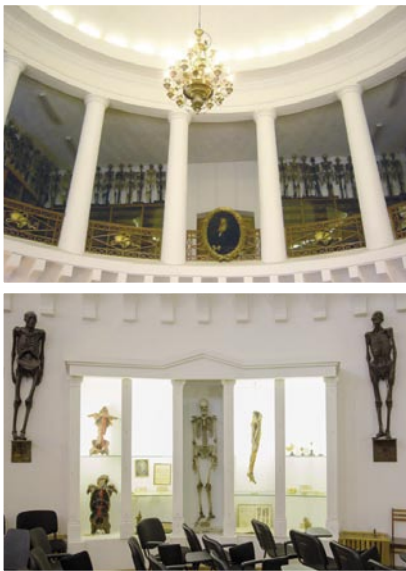
Рис. 9, 10. Анатомический музей Казанского университета.