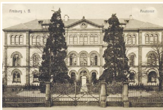
Рис. 6. Анатомический музей, Фрейбург.