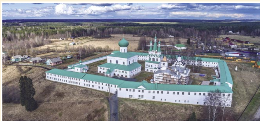
Рис. 12. Свято-Троицкий Александро-Свирский монастырь.

бесценное сокровище Церкви». Сейчас мощи Александр Свирского находятся в мужском монастыре в Ленинградской области, носящем его имя (Рис. 12).