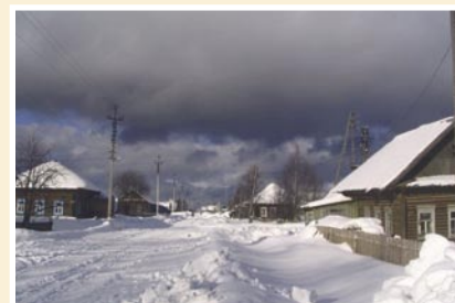
Рис. 2. Село Коса. 2000-е годы.

семья переехала в Пермь, чтобы Владимир продолжил свое образование в Пермской мужской гимназии (Рис. 4). В 1895 г. В.Н. Тонков с отличием окончил Императорскую военно-медицинскую академию. С 3-го курса он увлеченно изучал анатомию, на это повлиял авторитет