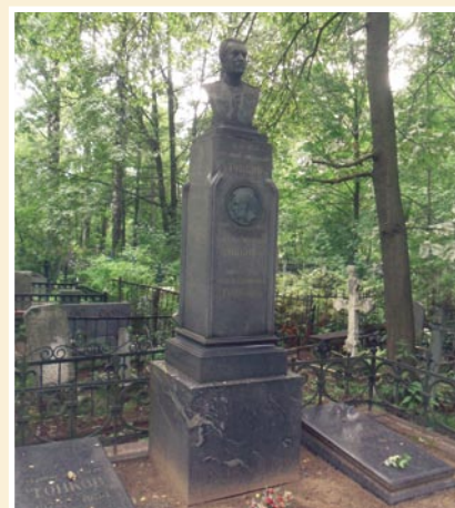
Рис. 13. Могила генерал-лейтенанта м/с Владимира Николаевича Тонкова на Богославском кладбище Санкт-Петербурга.