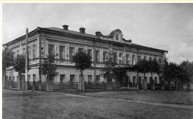
Рис. 3. Чердынское городское четырехклассное мужское училище (начало XX в.).

АКАДЕМИК ВЛАДИМИР НИКОЛАЕВИЧ ТОНКОВ И ЕГО РОЛЬ В ИСТОРИИ ОТЕЧЕСТВЕННОЙ НАУКИ И СУДЬБЕ ВОЕННО-МЕДИЦИНСКОЙ АКАДЕМИИ (К 150-ЛЕТИЮ СО ДНЯ РОЖДЕНИЯ)