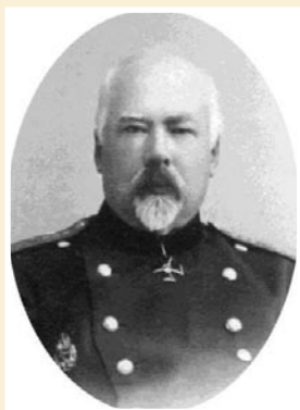
Рис. 5. Профессор Александр Иванович Таренецкий.