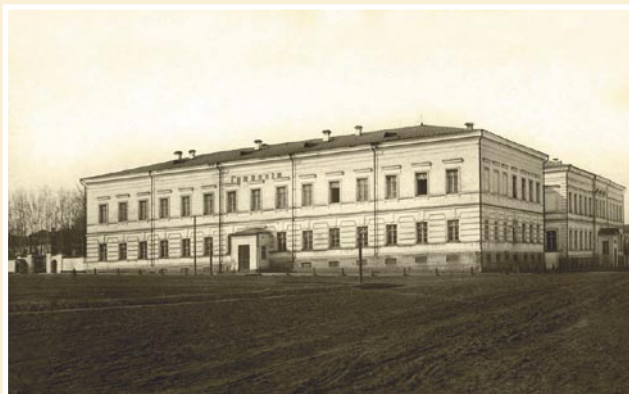
Рис. 4. Пермская мужская гимназия (конец XIX в.).