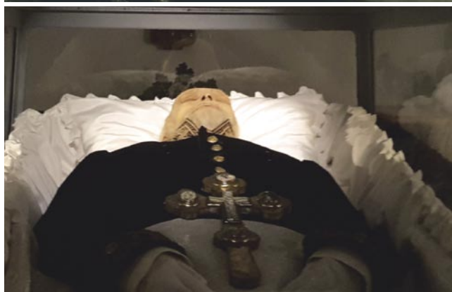
Рис. 8. Н.И. Пирогов в склепе (фото 2019 года).