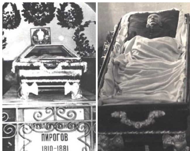
Рис. 6. Тело Н.И. Пирогова после ребалязамирования в 1956 году.

Гудымович В.Г. МЕСТО УПОКОЕНИЯ Н.И. ПИРОГОВА