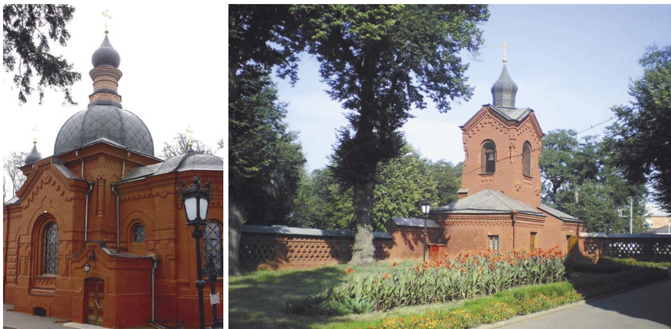
Рис. 5. Церковь Святого Николая Чудотворца и склеп Н.И. Пирогова.

его санитарное состояние оставляло желать лучшего. Лицо Н.И. Пирогова еле-еле можно было рассмотреть сквозь узкую полоску стекла в верхней части гроба, густо закапанной каплями свечного воска. В доме ученого — «никаких следов жизни». Сад — «забыт», «запущен». Тело могло бы и не сохраниться до наших дней. С учетом исторических событий первой половины XX века о Пирогове забыли. В 1930 г. грабители похитили нательный крест, ордена и шпагу Пирогова. Нарушен был и микроклимат в склепе.