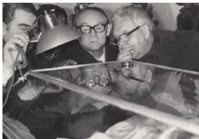
Рис. 7. Осмотр группой ученых тела Н.И.Пирогова перед отправкой в Москву для ребалязамирования (1978 г.).

Но самым важным в этом является память, светлая память о великом сыне нашей земли, хирурге, которому не было равных. Именно память благодарных потомков дает тот духовный порыв, который только обостряется у могилы Н.И. Пирогова. А поток посетителей поистине огромен: по данным Национального музея-усадьбы Н.И. Пирогова в Виннице с экспозицией ознакомились более 7 млн человек из более чем 168 стран мира. «Я очень счастлив, что встречаюсь с ним здесь, на пространстве, где никто не заслонит его лицо, и говорю ему: солнце! Я тебе благодарен. Ты сеешь в мою душу золотой посев — кто знает, что выйдет из того семени? Может, огни? Ты дорого мне. Я пью тебя, солнце, твой теплый исцеляющий напиток, пью, как ребенок молоко из материнской груди, такое же теплое и дорогое...» (М.Коцюбинский, новелла «Intermezzo»).