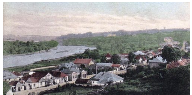
Рис. 1. Фото начала XX века. Вид на Садки и Южный Буг с высоты птичьего полета.

Из под его пера в это время выходят «Начала общей военно-полевой хирургии, взятые из наблюдений военнопоспитальной практики и воспоминаний и Крымской войне и Кавказской экспедиции» (Дрезден, 1865–1866), «Университетский вопрос» (1863), Из Гейдельберга (1863), По поводу занятий русских ученых за границей (1863,