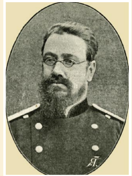
Рис. 9. Профессор Кронид Федорович Славянский.

на свет новые граждане. Примечательно, что в блокаду она пострадала от осколка вражеского снаряда, был поврежден шлем, который лично восстановлен В.А. Струковым (заведовал кафедрой 1970–1974 гг.). Поклонение этой статуе не носит обрядового или религиозного характера.