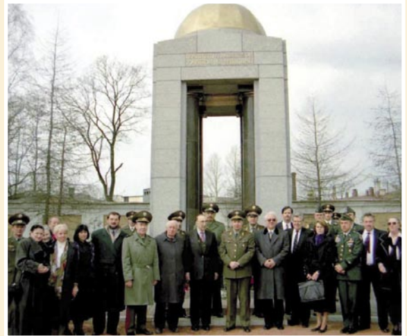
Рис. 7. На открытии памятника военным медикам, павшим в войнах.

дует за ними». Между боковыми колоннами часовни укреплены бронзовые композиции из щитов, на которых начертаны цитаты Гомера и Чехова: «Многих воителей стоит один врачеватель искусный» и «Профессия врача — это подвиг. Она требует самоотвержения, чистоты души и чистоты помыслов». Всей своей величественной строгостью мемориал как бы свидетельствует о жертвенной природе профессии военных медиков, являясь в то же время знаком безмерной благодарности ушедшим поколениям.