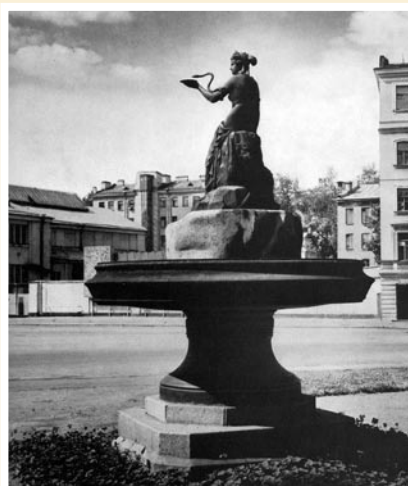
Рис. 3. В 1951 году памятник был перенесён на другую сторону Боткинской улицы.