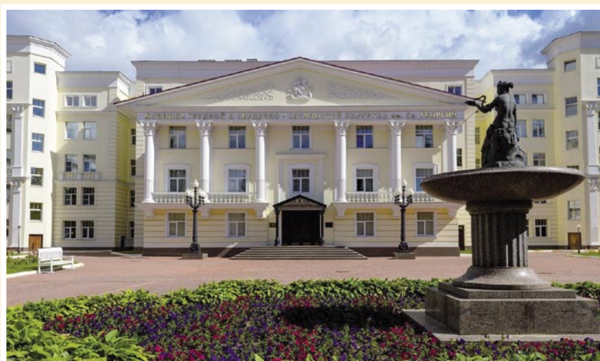
Рис. 5. Копия статуи Гигиены в Пироговском Центре.

Как это не печально, но в те годы появился дикий обычай для цивилизованных людей: в ночь перед выпуском находились неадекватные личности, которые начищали грудь статуи до ослепительного блеска, нанося очевидный вред произведению искусства. Конец этому ритуалу вандализма был положен в 1996 году решением Ю.Л. Шевченко переместить статую на закрытую территорию в сквер перед штабом Академии. Здесь традиция торжественного фотографирования выпускников, почетных гостей, молодожёнов приобрела статус официального ритуала (Рис. 4) [4]. Сакральность статуи заключается в том, что она символизирует для выпускника отчий дом, куда человек стремится вернуться до последней возможности. Это особый знак для безудержной радости от нахлынувших воспоминаний. Столь сильное воздействие на восприятие окружающих, как не удивительно, со-