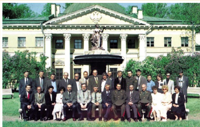
Рис. 4. 20-летие выпуска 1974 года.

врачу-клиницисту (они располагались спиной друг к другу) продолжалось четыре десятилетия. В 1949 году статую Гигиены переместили на противоположную сторону Боткинской улицы, где у неё появился собственный сквер, и простояла она там почти полвека (Рис. 3). Для многих поколений питомцев и сотрудников Академии это стало излюбленное место для романтических встреч. Но вскоре статуя обрела особый смысл, став как бы вещественным символом самой Академии. Для многих эта статуя отождествлялась не с мифологической богиней, а материализованным воплощением самого духа Alma mater. Это стало местом юбилейных встреч выпускников с обязательным фотографированием.