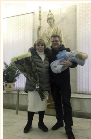
Рис. 10. Счастливые родители с новорожденным у статуи Афины.