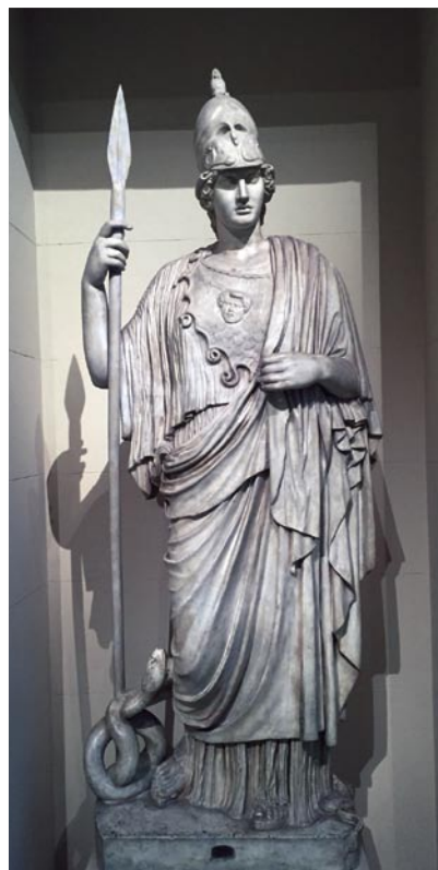
Рис. 8. Подлинник — мрамор, римская копия статуи круга Фидия, конец V века до н.э.; хранится в Музеях Ватикана, Рим.