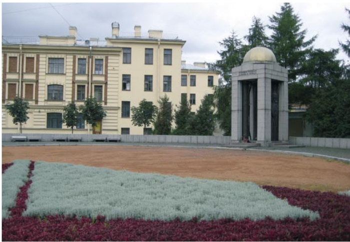
Рис. 6. Памятник военным медикам, павшим в войнах.