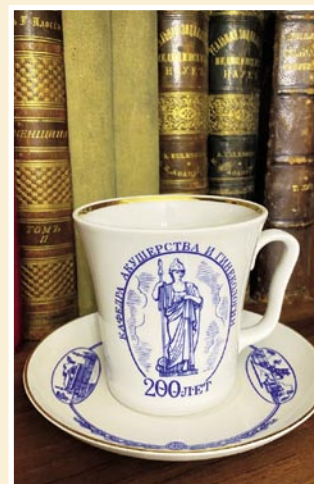
Рис. 13. Продукция Ломоносовского фарфорового завода к 200-летию кафедры акушерства и гинекологии Академии.

Сакральное значение скульптурного изображения двух древнегреческих богинь однозначно позитивно. Это отнюдь не какой-то возврат к язычеству, а скорее внешнее проявление безмерной благодарности своим учителям и наставникам, исключительно добрая память о своих сокурсниках, безграничное почитание врачебной профессии.