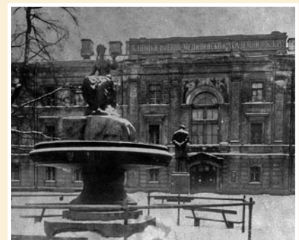
Рис. 2. Из выпускного альбома Военно-Медицинской Академии, 1935 г.