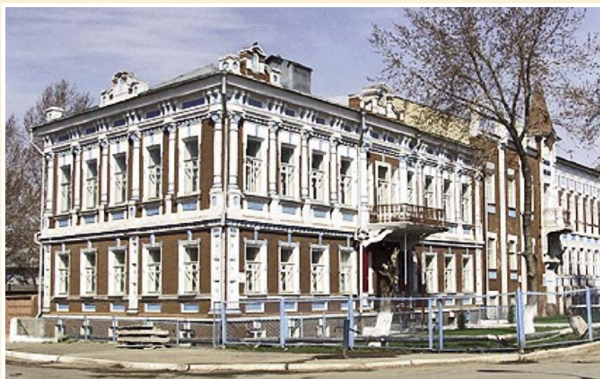
Рис. 2. Здание железнодорожной клинической больницы станции Оренбург, в котором работал А.С. Альтшуль. В настоящее время после ремонта в здании размещены институт клеточного и внутриклеточного симбиоза и Институт степи Уральского отделения РАН.

В годы Великой Отечественной войны Альтшуль продолжал хирургическую деятельность, в том числе оперировал многих раненых военнослужащих,