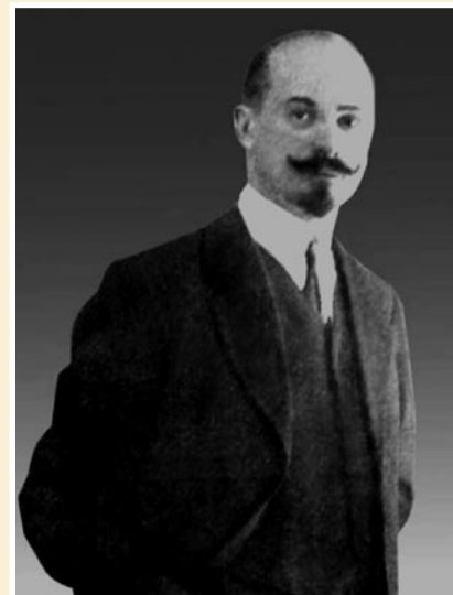
Рис. 1. Профессор Михаил Борисович Юкельсон (1867–1938).

«Я в ваши годы еще не отдыхал. Между прочим, в приемное доставили больного — займитесь...». Обучаясь в интернатуре, Альтшуль целыми сутками находился в клинике среди больных. За эти годы он хорошо освоил хирургическую технику и диагностику заболеваний, приобрел хорошие практические навыки. От своего учителя А.С. Альтшуль перенял педантичность при выполнении хирур-