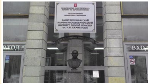
Рис. 6. НИИ скорой помощи имени И.И. Джанелидзе (центральный вход в здание)

кой Отечественной войне 1941—1945 гг.». Он был награжден двумя орденами Ленина, орденом Красного Знамени и медалями. Правительство Советского Союза учредило две студенческие стипендии имени И.И. Джанелидзе и присвоило его имя Ленинградскому научно-практическому институту скорой помощи в декабре 1950 г. (Рис. 5, 6).