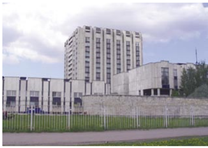
Рис. 5. НИИ скорой помощи имени И.И. Джанелидзе (общий вид).