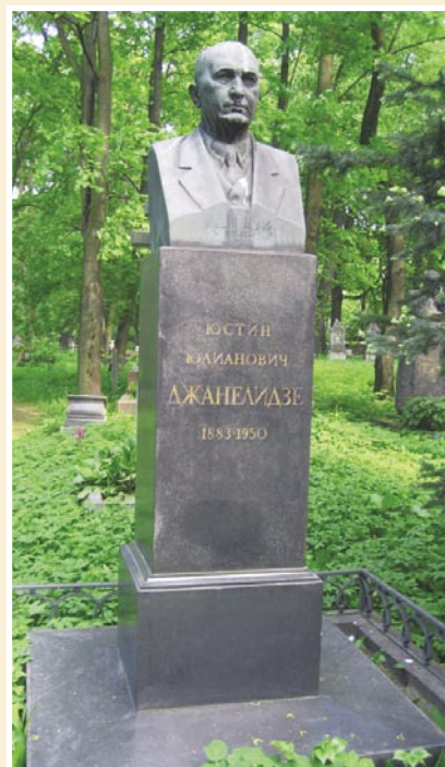
Рис. 4. Могила Ю.Ю. Джанелидзе на «Литераторских мостках» (Волковском кладбище, некрополь) в Санкт-Петербурге.

Авторитет Ю.Ю. Джанелидзе был очень велик среди коллег и пациентов. Он был председателем XXV Всесоюзного съезда хирургов, неоднократно избирался председателем Хирургического общества имени Н.И. Пирогова в Ленинграде, был его почетным членом. В 1946 г. (после смерти академика Н.Н. Бурденко) Ю.Ю. Джанелидзе был избран председателем правления Всесоюзного общества