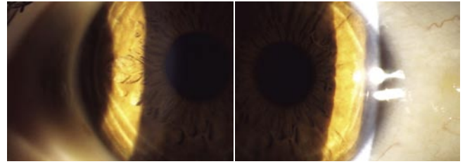
Рис. 3. Фото переднего отрезка глаза после репозиции за щелевой лампой при стандартном освещении.

Несмотря на то, что послеоперационные осложнения после ФемтоЛАСИК встречаются редко, немаловажным представляется не только акцентирование внимания хирургов на данной проблеме, но также и неоперирующих офтальмологов, которые могут столкнуться