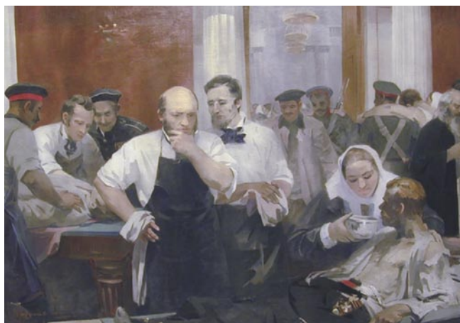
Рис. 6. М.П. Труфанова Н.И. Пирогов на Главном перевязочном пункте в зале Дворянского собрания.