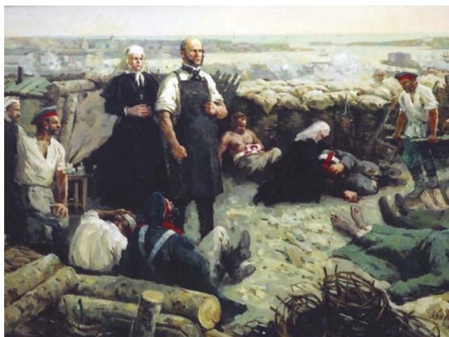
Рис. 4. Н.И. Пирогов на передовом перевязочном пункте Севастополя.