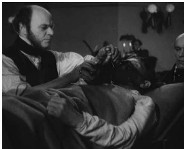
Рис. 2. Пирогов применяет эфирный наркоз (кадр из фильма «Пирогов»).

По мере внедрения эфирной анестезии Пирогов совершенствовал и оборудование для доставки анестетика в дыхательные пути больного. При первых анестезиях он использовал обычную зелёную бутылку с простой резиновой трубкой для ингаляции через нос пациента, а также приспособление, предложенное французом Шарьером. Безусловно, эти примитивные инструменты не удовлетворяли Н.И. Пирогова. В результате совместно с мастером Л. Роохом он сконструировал собственный прибор и маску для эфирной ингаляции (Рис. 3) [4; 5]. Маска позволила производить введение анестетика непосредственно во время хирургического вмешательства, не прибегая к помощи ассистента. Клапан давал возможность регулировать смесь эфира и воздуха для управления глубиной наркоза. Кроме того, Пирогов и Роох создали аппарат для ректального наркоза, который применяли как альтернативу ингаляции эфира при непереносимости вдыхания паров, выполнении хирургических вмешательств в челюстно-лицевой области, операций вблизи источников открытого огня. Уже к концу 1847 года на Петербургском инструментальном заводе, директором которого Пирогов по совместительству являлся, было запущено серийное производство наркозных аппаратов и масок для госпиталей и больниц России.