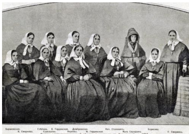
Рис. 7. Сёстры милосердия первого набора — Крестовоздвиженской общины, 1855 г, Севастополь.

цинской помощи пациентам в терминальном состоянии, которое стало прогрессирующим и/или неизлечимым. В рамках этого направления пациентам обеспечивается ряд медицинских, юридических, этических и духовных норм, многие из которых были заложены еще Пироговым.