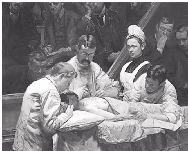
Рис. 1. Томас Икинс. Операция с применением наркоза (фрагмент), 1889 г.

февраля 1847 года Н.И. Пирогов выполняет две первые операции в условиях эфирного наркоза во Втором Военно-сухопутном госпитале Санкт-Петербурга (Рис. 2). Во время одного из этих вмешательств выдающийся хирург в течение 1–2 мин. выполнил мастэктомию. Она прошла совершенно безболезненно для пациентки и, очнувшись через 8 минут после наркоза, женщина спросила: «Почему не сделали операцию?» [6]. 16 февраля 1847 года Н.И. Пирогов проводит операцию с эфирным наркозом в Обуховской больнице. 27 февраля состоялась уже четвертая операция с использованием эфирной анестезии в Госпитале Петра и Павла, в Санкт-Петербурге. Это вмешательство было выполнено молодой девушке с гнойным воспалением культи после ампутации ноги.